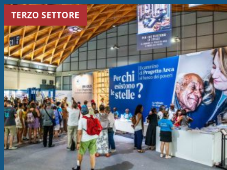
Progetto Arca, la fragilità e l'impegno in mostra al Meeting di Rimini