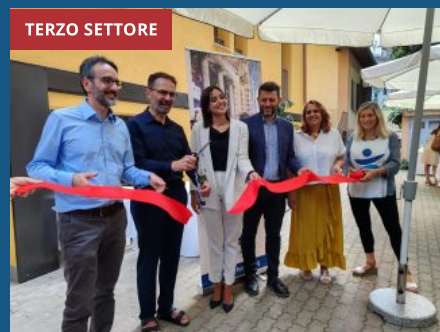
Casa, Progetto Arca: inaugurato nuovo 'condominio sociale' in viale Bodio