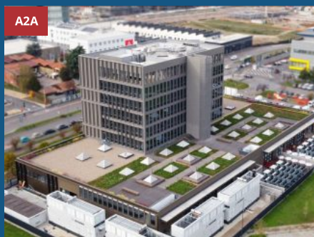
Teleriscaldamento, il progetto di A2A per recuperare energia dai Data Center